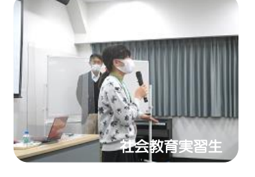
きたまち保育サポーター