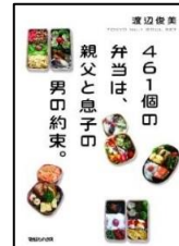
『461個の弁当は、親父と息子の男の約束。』 渡辺俊美/著 マガジンハウス 596