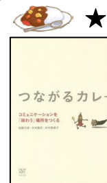
『つながるカレー コミュニケーションを味わう場所をつくる』 加藤文俊/著 361