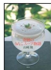
『奇跡のりんご スープ物語』 山崎隆/著 講談社 596