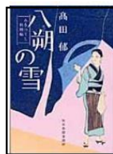
『八朔の雪 一みをつくし料理帖』 高田郁/著 角川春樹事務所 B913.6/タカ