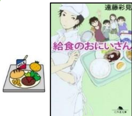
『給食のおにいさん』 遠藤彩見/著 幻冬舎 B913.6/エン