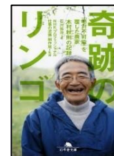
『奇跡のリンゴ』 石川拓治/著 幻冬舎 625