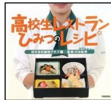
『高校生レストラン ひみつのレシピ』 三重県立相可高校調理クラブ/編 伊勢新聞社 673