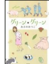
『グリーン・グリーン』 あさのあつこ/著 徳間書店 913.6/アサノ