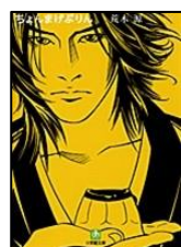
『ちょんまげぷりん』 荒木源/著 小学館 B913.6/アラ