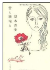
『雪と珊瑚と』 梨木香歩/著 角川書店 913.6/ナシキ