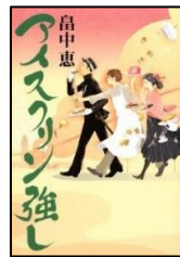
『アイスクリン強し』 畠中恵/著 講談社 B913.6/ハタ