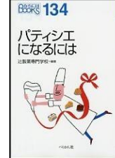
『パティシエになるには』 辻製菓専門学校/編著 ペリかん社 366