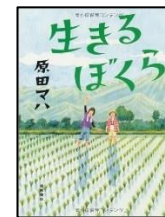
『生きるぼくら』 原田マハ/著 徳間書店 913.6/ハラダ