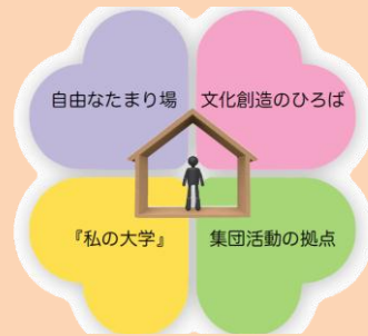
公民館の4つの役割