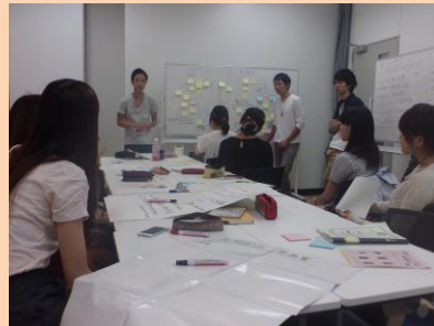
準備会では、進行や記録も参加者担当