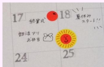
○スケジュール表もデコシール○

定員 20人(申込順) 対象 市内在住・在勤・在学の小学4年生以上から25歳くらいまでの方 参加費 500円 持ち物 カッター、はさみ、黒の極細油性ペン 申込 電話、Eメールまたは直接、公民館貫井北分館まで ☎042-385-3401