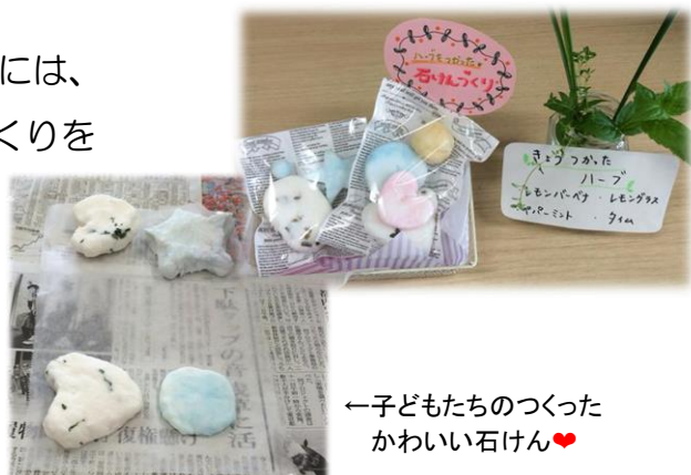
←子どもたちのつくった かわいい石けん♥

園芸部員でない子どもたちも参加して、 みんな思い思いの形の石けんをつくったよ。 ハーブについてもすこし知ってもらえたかな？